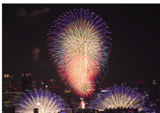
商工会議所 会頭賞「ビル間の花火」 (前川敏夫氏)