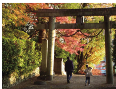
大阪 21 世紀協会賞「紅葉の伊居田神社」 (塚原由雄氏)